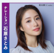
ナレーション 石原さとみ