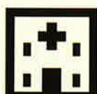
依存症専門 医療機関