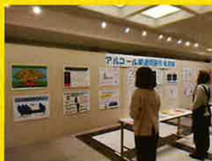
飯豊町町民総合センター

米沢市役所 11月11日(月)～11月15日(金) 飯豊町町民総合センター 11月16日(土)～11月22日(金) 置賜総合支庁(米沢市) 11月18日(月)～11月29日(金)